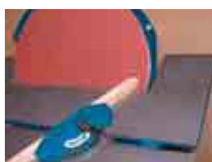
Lijado a inglete con la guía de inglete