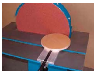
Lijado de piezas redondas con dispositivo de lijado curvo

TSM 600 con mesa grande y motor de revoluciones infinitamente variables