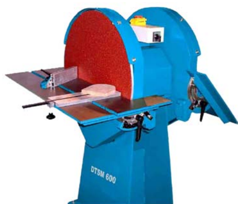
DSTM 600 con accesorios: guía de inglete y dispositivo de lijado curvo