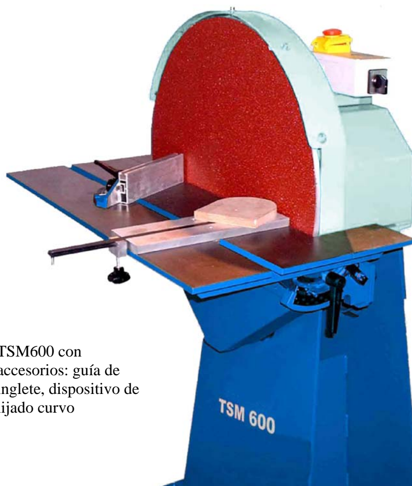
TSM600 con accesorios: guía de inglete, dispositivo de lijado curvo