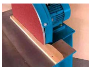
Lijado de cantos