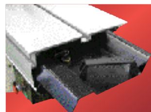
Carro deslizable de precisión